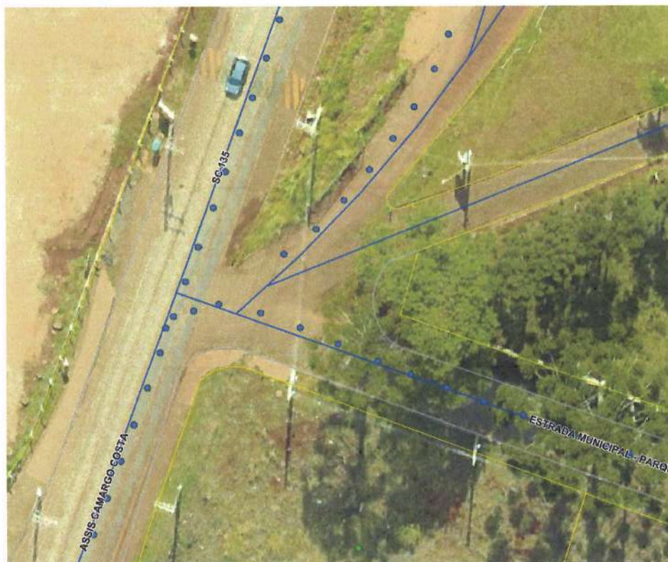
Figura 01: Localização do terreno da obra

O terreno localiza-se próximo à SC-135, acesso a Escola Municipal Novos Campos, bairro Boa Vista, Campos Novos SC. A obra será locada conforme orientações do projetista, seguindo parâmetros do projeto estrutural.